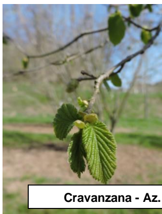
Cravanzana - Az. Nasio 29/03/2021

Nella settimana dal 23 al 31 marzo, la situazione fenologica si è evoluta in molte zone per effetto del caldo. In altre zone le temperature notturne e delle prime ore del mattino ancora basse hanno rallentato lo sviluppo delle nuove foglioline.