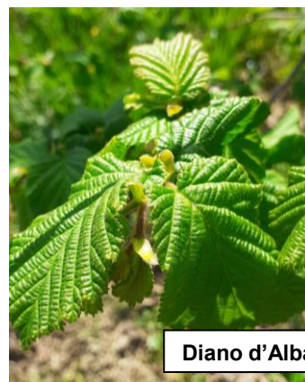
Diano d'Alba -29/03/2021