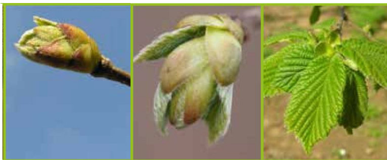
C - Rottura gemme