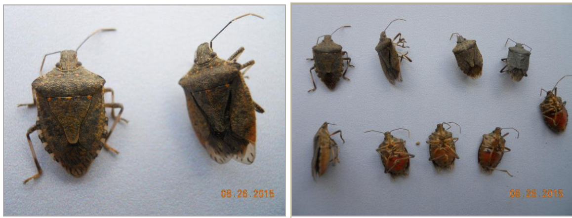
Fig. 1-2 - Adulti di Halyomorpha halys catturati in nocchieletto a Carrù (CN)

Dai monitoraggi effettuati in nocchieletto in questi giorni si segnala che, nella zona di Carrù, sono stati rinvenuti adulti e neanidi della cimice della frutta Halyomorpha halys (fig. 1 e 2 ).